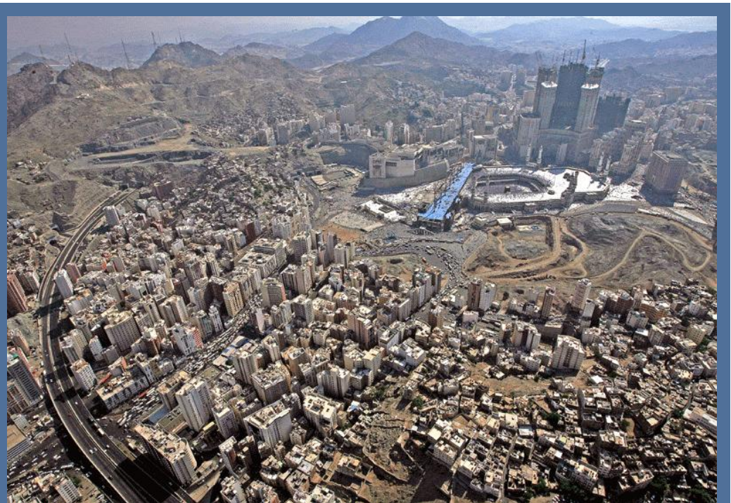
Mekka ein Sinnbild des Baubooms in Saudi-Arabien / Makkah a symbol of the booming construction sector

Due to the high prices for crude oil Saudi Arabia has a big budget surplus, which is planned to be invested in the expansion of large infrastructure and housing projects. Germany still has an excellent reputation regarding supply, education, research and technology - "Made in Germany" is a proof of quality in the Gulf region. The delegation of the construction sector was a combination of meetings with architects and planners, potential business partners, networking events and common visits of selected construction projects.