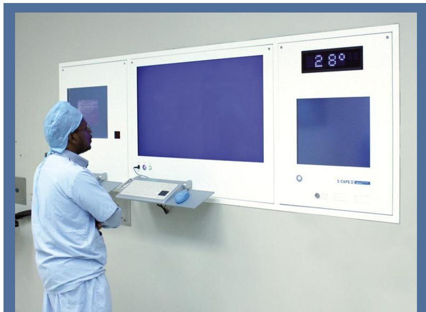
Fortschrittliche Telemedizin: die sächsische Firma S-Cape installiert Operationsräume in Saudi-Arabien / Telemedicine state of the art: the Saxonian Company S-Cape installs operation theaters in Saudi Arabia