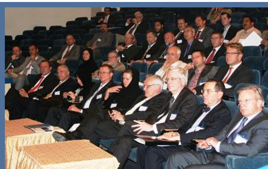
Die Delegation und Mitglieder des Deutschen Wirtschaftskreises beim Vortrag im TTC The German delegation and Members of the German Business Circle at the presentation at the TTC