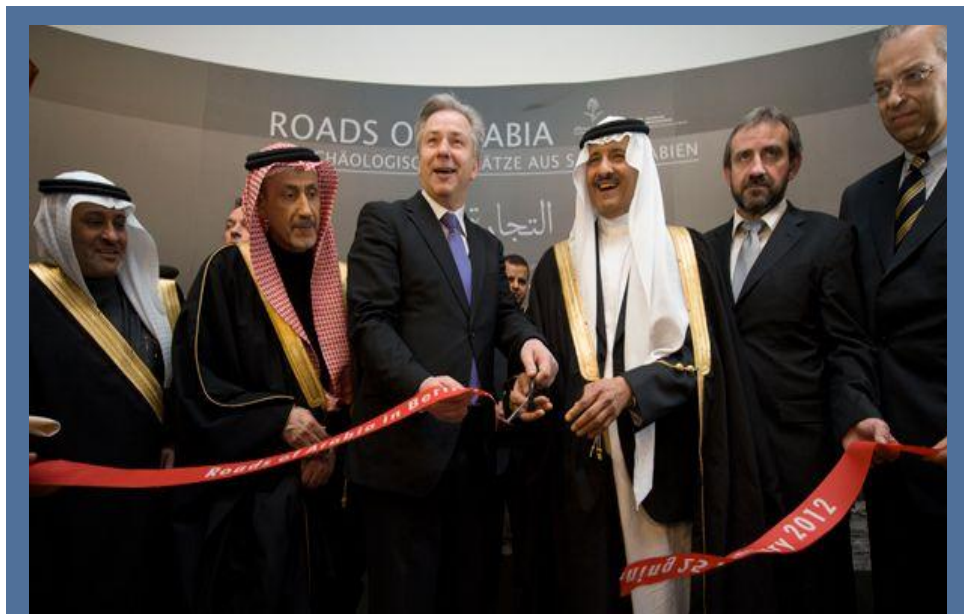
Prinz Sultan bin Salman und Klaus Wowereit bei der Ausstellungseröffnung Prince Sultan bin Salman and Klaus Wowereit at the inauguration of the exhibition

Deutsche Forschungsprojekte der Orientabteilung des Deutschen Archäologischen Instituts, des Zentrums Moderner Orient und der Berlin-Brandenburgischen Akademie der Wissenschaften in Saudi-Arabien werden in einem Ausstellungsraum als internationale Wissenschaftskooperation Berliner Institutionen präsentiert. Zudem wird interessierten Besucherinnen und Besuchern ein reiches Begleitprogramm zur Kulturgeschichte der Arabischen Halbinsel angeboten.