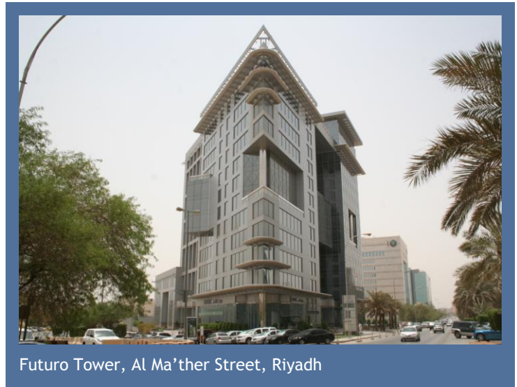
Futuro Tower, Al Ma'ather Street, Riyadh

Die AHK Saudi-Arabien (GESALO) ist umgezogen. Seit Montag, den 15. August 2011 befindet sich das Büro der Delegation der Deutschen Wirtschaft im vierten Stock des Futuro Towers in der Ma'ather Street in Riad. Dieser ist sowohl von außerhalb als auch aus dem Stadtzentrum sehr gut zu erreichen. Die Kontaktaufnahme mit vielen wichtigen Stellen, wie z.B. dem Innen- und Wirtschaftsministerium oder auch zahlreichen Banken, wird so im Bedarfsfall deutlich vereinfacht. Darüber hinaus sind die neuen Räumlichkeiten der ideale Ort, um auch in Zukunft Kunden und Partner über die vielfältigen Möglichkeiten des rasant wachsenden Marktes in Saudi-Arabien zu informieren. Die AHK Saudi-Arabien unterstützt deutsche Unternehmen beim Markteintritt in Saudi-Arabien sowie saudiarabische Unternehmen in ihren wirtschaftlichen Beziehungen zu Deutschland.