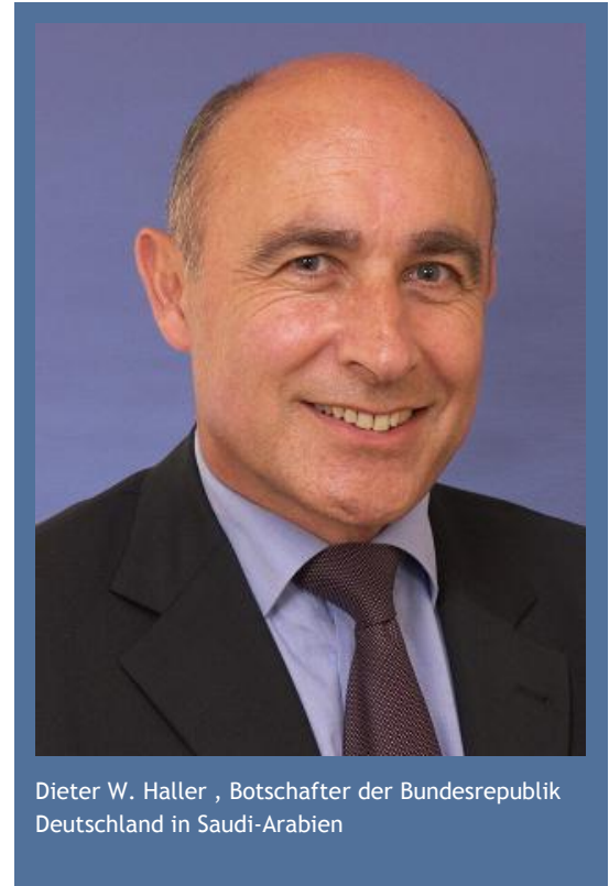
Dieter W. Haller , Botschafter der Bundesrepublik Deutschland in Saudi-Arabien